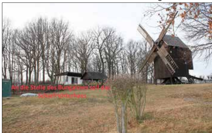
Neuer Standort - auf dem Gelände der Bockwindmühle Luga