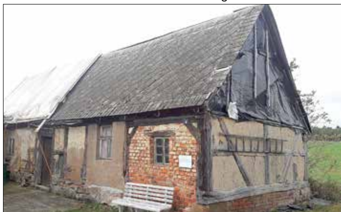
Das Scharfrichterhaus in Lissahora

Der Artikel "Lissahora - ein Scharfrichter geht auf Reisen - Teil 2" von Arnd Matthes erscheint in der nächsten Ausgabe.